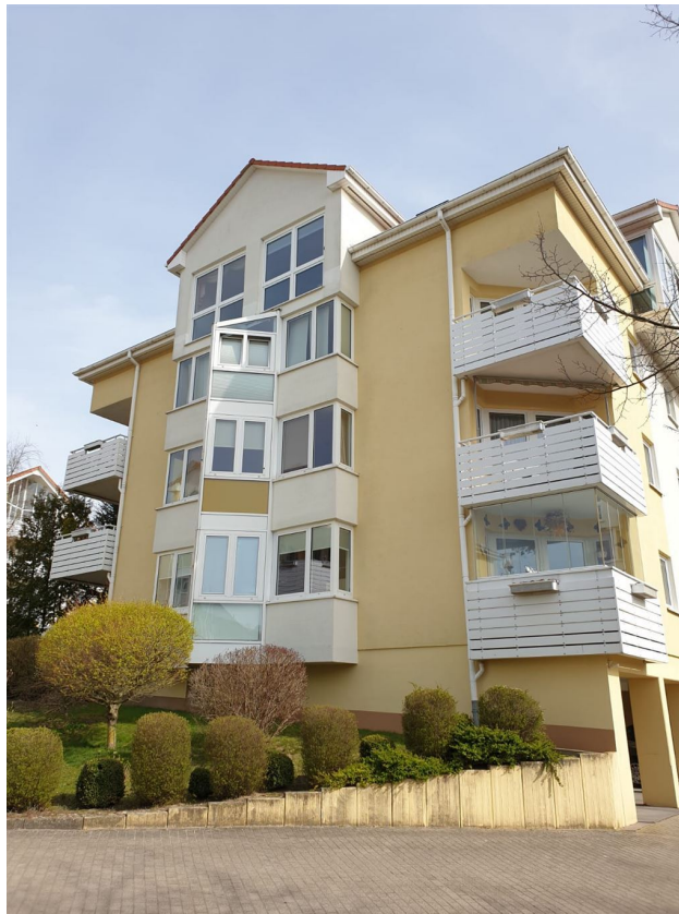
Platanenstr. 14c, 17033 Neubrandenburg